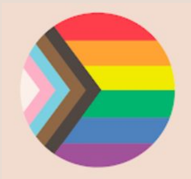
Sexuell läggning eller könsöverskridande identitet