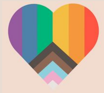
Sexuell läggning, könsöverskridande identitet